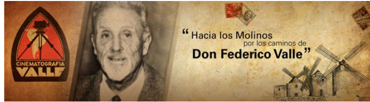
Görsel 8-9: Walt Disney'e ait "Snow White and Seven Dwarfs" filmi (1937). "The Apostle-Elçi-Öncü" filminin (1917) yönetmeni Arjantinli Yönetmen Don Federico Valle.