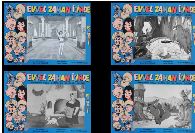
Görsel 14: Evvel Zaman İçinde filminin DGS öğrencileri tarafından yapılan afişlerinden bazıları.