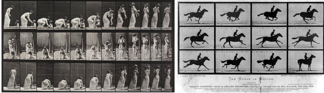
Görsel 1-2: Edward Muybridge'in özel düzenekle oluşturduğu hareketin fotoğrafı sanatının örnekleri.

Muybridge'in 6 fotoğrafla hareketi arayan sanatçı olarak tarihte önemli bir yer edinmiştir. Önce hareketin aktarımı ardından bu hareketin bir kompozisyon dahilinde sergilenmesi sinemanın ilk nüvelerini oluşturmuştur.