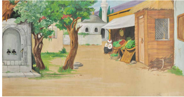
Görsel 15-16: Evvel Zaman İçinde filminden mekân tasarım örnekleri.

Bu filmde bugün elimizde olan 16 mm'lik 2-3 dakika uzunluğunda (dans eden Gülderen Sultan) siyah-beyaz iş kopyasıdır. Mahkemede de gösterilen bu kopya filmin kalitesi hakkında da bizlere fikir vermesi açısından önemlidir. Yüksel Ünsal filmin "Disney filmi kadar başarılı" bulunduğunu belirterek kaybolma süreciyle ilgili şunları söylüyor: