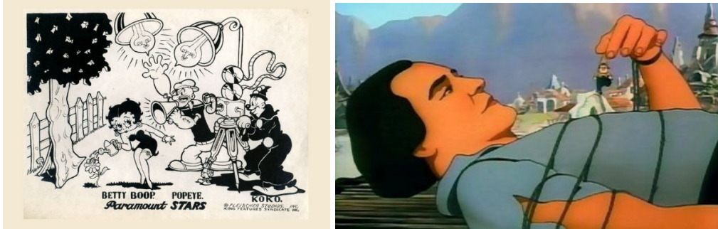
Görsel 6-7: Fleischer Stüdyosu tarafından gerçekleştirilen Betty Boop, Popeye, Koko the Clown ve Güliver karakterleri.

İlkler üzerinden canlandırma sinemasına devam ederken, günümüze değin canlandırma sinemasında kullanılan diğer bir teknik de rotoskopordan da bahsetmek gereklidir. Polonya asıllı Amerikalı animatör, yönetmen, yapımcı Max Fleischer, animasyonun gelişmesindeki öncüler arasında yer almaktadır. Fleischer Stüdyosu'nu kardeşi Dave ile beraber kurdular. Max Fleischer animasyon dünyasına birçok yenilik kattı. Bunlardan en önemlisi “rotoskop” adındaki icadıdır. Rotoskop tekniğiyle, hareketli kayıttan referans alınarak görüntüler kare kare çizilir, bu da oldukça kolaylaştırıcı bir yöntemdir. İkinci buluşu olan “rotograph” tekniğiyle de animasyon görüntüleri ile live-action görüntülerini birleştirmeyi kolaylaştırmıştır. Fleischer Stüdyosu: Kendilerinin tasarladıkları Betty Boop, Popeye gibi kısa dizi çizgi filmlerin yanı sıra, “Snow White and 7 Dwarfs”ın başarısından etkilenerek, 1939 yılında “Güliver’in Seyahatleri”ni gerçekleştirdi. Bu çizgi filmdeki Güliver karakteri, rotoskop tekniğine iyi bir örnektir.