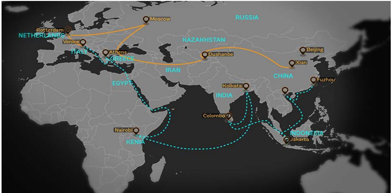
Şekil 1. BKBY Projesinin Güzergâhları

Olarak altı ana koridor güzergâhlarına bölünmektedir. Şimdiye kadar belirlenen bu koridorlar üzerinde oluşan rotaların birincisi, Doğu Türkistan'dan Kazakistan-Rusya-Beyaz Rusya üzerinden Avrupa'ya ulaşırken, bir diğeri ise, Doğu Türkistan'dan Kazakistan-Azerbaycan-Gürcistan-Türkiye-Balkanlar üzerinden Avrupa'ya gitmektedir. Bir diğer güzergâhı ise yine Doğu Türkistan'dan başlayıp Batı Türkistan'daki Türk Cumhuriyetleri'nin değişik rotalarından geçerek Pakistan üzerinden İran'a ve oradan Ortadoğu'ya bağlanan güzergâhtır. Çin ayrıca Kaşgardan Pakistan'ın Gwadar limanına uzanan bir güzergâha bugüne kadar ciddi yatırımlar yapmıştır. Çin, Pakistan'dan kiraladığı Gwadar limanını hem donanması için bir askeri merkez hem de Basra Körfezi, Süveyş ve Doğu Afrika rotalarından yürüttüğü ticaret için alternatif nakil yolu haline getirmek istediği için büyük önem vermektedir (Bayraç, 2021:1357). Şekil 1'de BKBY projesinin güzergâhları rotalar ile sunulmuştur.