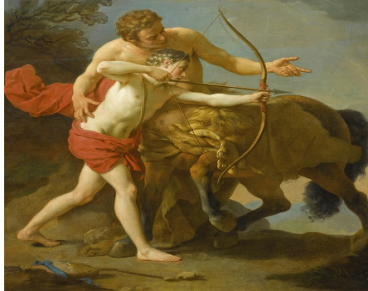
Şekil 1. Kheiron ve Akhilleus

“Uzaklara ok atan Apollon, korkunç bir aslanla dövüşen Kyrene’yi 30 gördüğünde, Kherion’a seslendi: “Ey Philyra’nın oğlu. O kutsal mağarandan çık da şaşırıp kal şu genç kızın cesaretine ve gücüne. Nasıl da yiğitçe dövüşüyor... Hangi ölümlü babanın kızı o? Hangi soydan geliyor ki bu bulutlu dağların karanlık vadilerinde yaşıyor? Bu sınırsız cesareti nereden buluyor? Şanlı elimle ona dokunsam doğru olur mu?” O zaman –ilhamı bol- at adam kibarca gülerek yanıt verdi: “Yüce Phoibos 31 , Peitho’nun 32 kutsal seviyi açan anahtarları gizlidir. İnsanlar gibi tanrılar da aşkın ilk tatlı hazzını gün ışığında tatmaya utanırlar. Kapıldığın tutkuyla böyle konuşuyor olsan da sen de dokunmamalısın kutsal olana. Sen bu vadiye onun kocası olmak için geldin. Onu, denizleri aşır ulu Zeus’un güzel bahçelerine götürmek niyetindesin...” Kheiron böyle dedi ve tanrıyı, bu evliliği gerçekleştirmeye özendirdi” (Pindaros, 2015: 137).