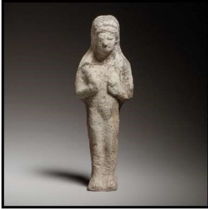
Ayakta Duran Kadın Figürini Görüntü 21: The Metropolitan Museum: The Cesnola Collection'dan figürin görüntüsü Accession Number: 74.51.1579 ( https://www.metmuseum.org/ )