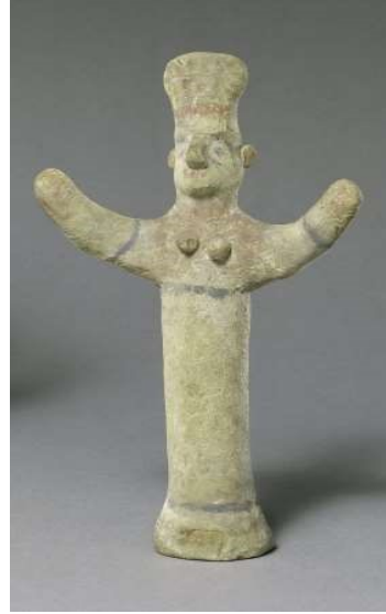
Kollarını Kaldırmış Tanrıça Tipinde Kadın Figürini

Görüntü 15: The Metropolitan Museum: The Cesnola Collection'dan figürin görüntüsü Accession Number: 74.51.1565 ( https://www.metmuseum.org/ )