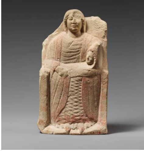
Emziren Anne Figürini Görüntü 17: The Metropolitan Museum: The Cesnola Collection'dan figürin görüntüsü Accession Number: 74.51.2528 ( https://www.metmuseum.org/ )