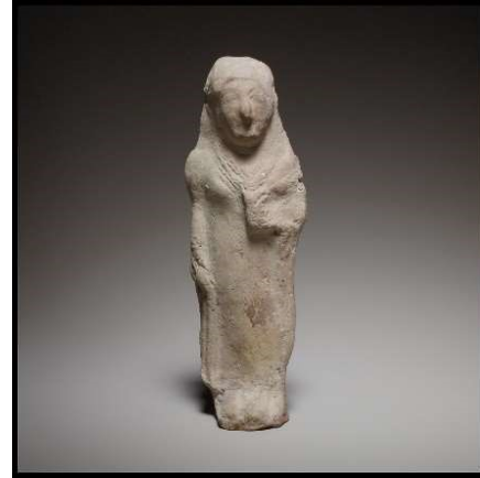
Ayakta Duran Kadın Figürini Görüntü 22: The Metropolitan Museum: The Cesnola Collection'dan figürin görüntüsü Accession Number: 74.51.1579 ( https://www.metmuseum.org/ )