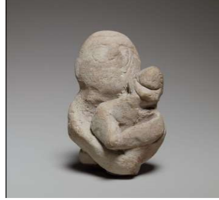
Doğum Sahnesini Sahneleyen Figürin Görüntü 18: The Metropolitan Museum: The Cesnola Collection'dan figürin görüntüsü Accession Number: 74.51.1441 ( https://www.metmuseum.org/ )