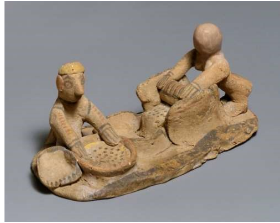
Un Yapanlar Figürini

Görüntü 19: The Metropolitan Museum: The Cesnola Collection'dan figürin görüntüsü Accession Number: 74.51.1556 ( https://www.metmuseum.org/ )