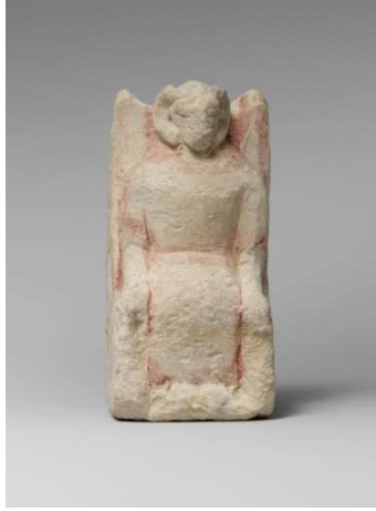
Zeus Ammon Figürini

Görüntü 11: The Metropolitan Museum: The Cesnola Collection’dan figürin görüntüsü