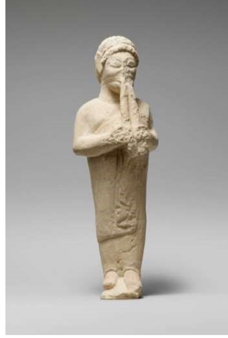
Fülüt Çalan Figürin

Görüntü 4: The Metropolitan Museum: The Cesnola Collection'dan figürin görüntüsü Accession Number: 74.51.2537