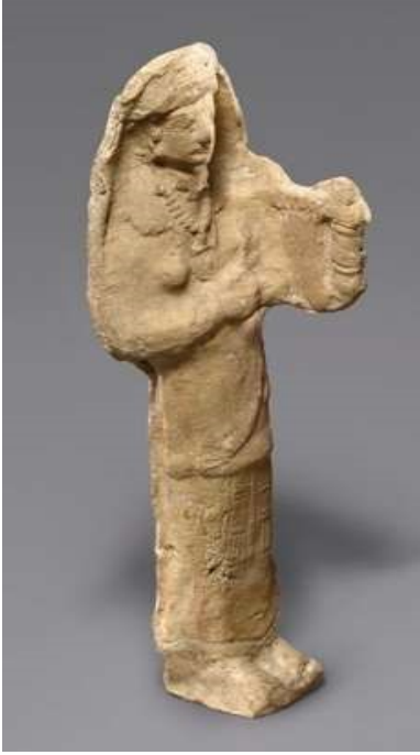
Lir Çalgıcısı Figürini

Görüntü 3: The Metropolitan Museum: The Cesnola Collection'dan figürin görüntüsü Accession