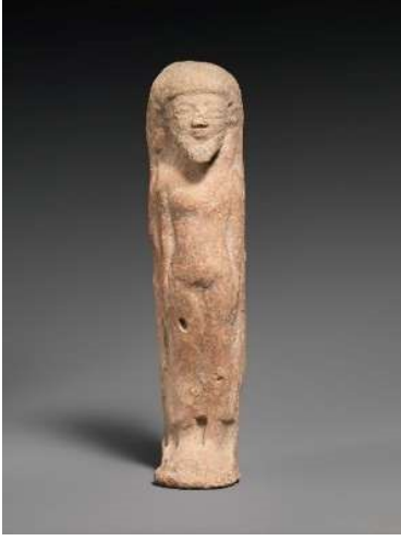
Ayakta Duran Figürin

Görüntü 15: The Metropolitan Museum: The Cesnola Collection'dan figürin görüntüsü Accession Number: 74.51.1565 ( https://www.metmuseum.org/ )