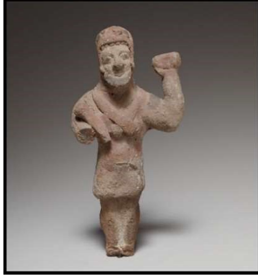
Ayakta Duran Herakles Figürünü Görüntü 9: The Metropolitan Museum: The Cesnola Collection'dan figürin görüntüsü Accession Number: 74.51.1601 ( https://www.metmuseum.org/ )