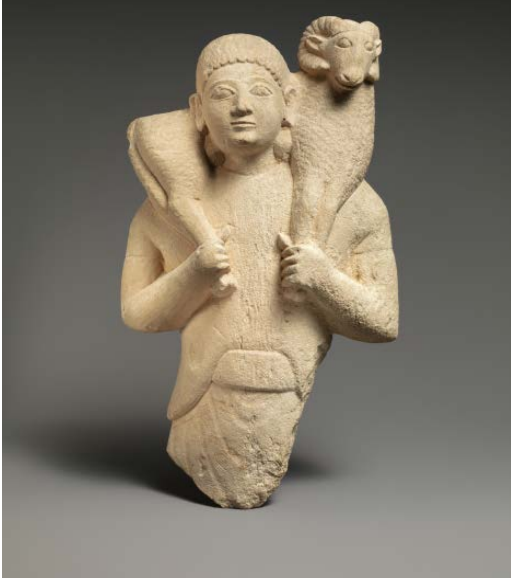
Koç Taşıyan Erkek Figürin

Görüntü 1: The Metropolitan Museum: The Cesnola Collection'dan figürin görüntüsü Accession Number: 74.51.2533 ( https://www.metmuseum.org/ )