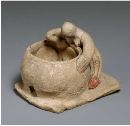
Ekmek Yapan Kadın Figürin

Görüntü 19: The Metropolitan Museum: The Cesnola Collection'dan figürin görüntüsü Accession Number: 74.51.1556 ( https://www.metmuseum.org/ )