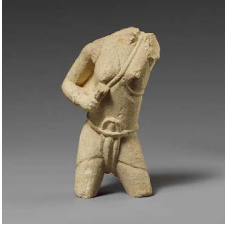
Savaşçı Kadın Figürin

Görüntü 5: The Metropolitan Museum: The Cesnola Collection'dan figürin görüntüsü Accession Number: 74.51.2573 ( https://www.metmuseum.org/ )