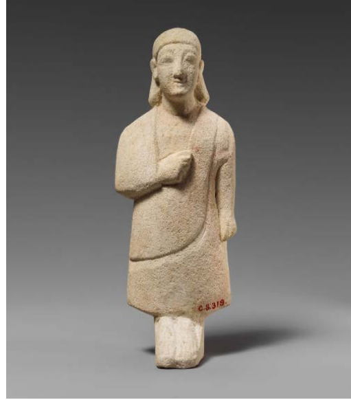
Tapınan Erkek Figürin

Görüntü 1: The Metropolitan Museum: The Cesnola Collection'dan figürin görüntüsü Accession Number: 74.51.2533 ( https://www.metmuseum.org/ )