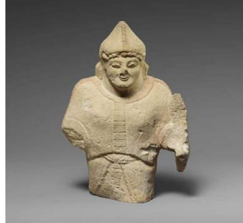
Kalkan Tutan Savaşçı Figürin

Görüntü 5: The Metropolitan Museum: The Cesnola Collection'dan figürin görüntüsü Accession Number: 74.51.2573 ( https://www.metmuseum.org/ )