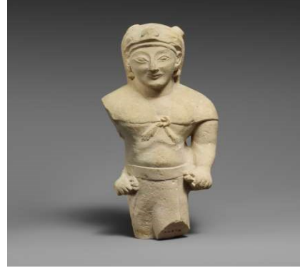
Okçu Herakles figürünü Görüntü 10