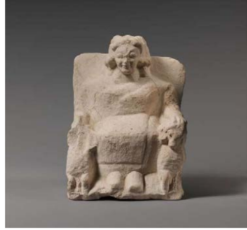
Zeus Ammon Figürini

Accession Number: 74.51.2560 ( https://www.metmuseum.org/ )