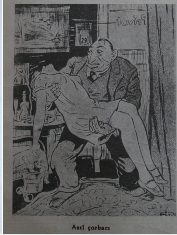
ŞEKİL 3: Milli İnkılap, 1 Mayıs 1934, sayı 1, s. 16