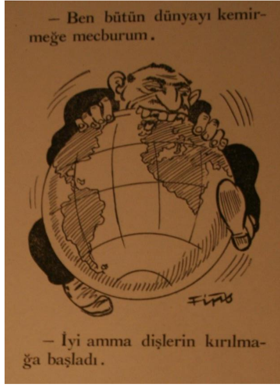
ŞEKİL 2: Milli İnkılap, 1 Haziran 1934, sayı 3, s. 16

Derginin Yahudileri “hayvansılaştıran” figürlerine cinsel figürler de eklenmiştir. Birçok karikatürde Yahudi erkekler “şehvet düşkün” olarak tasvir edilmiştir. “Şeref”, “haysiyet”, “namus” gibi “hiçbir insani erdemden nasibini almamış Yahudiler” bu figürler aracılığıyla da “hayvansılaştırılmıştır”. Bu figürlerin 1930’ların Türkiye’sinde nasıl bir etki uyandırabileceğini kestirmek güç değildir. Dergi, şiddet eylemleri yaşanmadan önce sayfalarına taşıdığı her görselle, kullandığı her sözcükle Yahudi toplumunu zihinlerde öldürmeye başlamıştır.