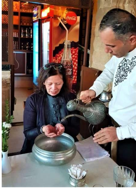
Fotoğraf 13. Cercis Murat Konağı'nda, içinde gül suyu olan ibrikle ellerin yıkanması, Mardin (Küçük Kurt, 2019).