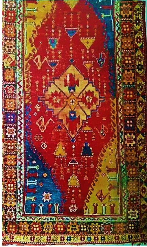
Fotoğraf 9. 19 yüzyılda 150x260cm boyutunda ve 24x20 kalitesinde dokunmuş Konya yöresine ait halıda ibrik motifi bulunmaktadır (Erbek, 1990:270).

Halı ve düz dokumalarda ibrik motifi yaygıların orta zemininin dört köşesine dokunmaktadır. Seccadelerde ise ayak ya da mihrabın üst kısmına yerleştirilmektedir. Genellikle ibrik motiflerinde açık tonlar tercih edilmektedir. Afyonkarahisar/Dazkırı, Başmakçı, Konya, Kars, Sivas gibi yörelerde yaygı ve seccadelerde ibrik motifi kullanılmıştır. Örneğin, Tokat Mevlevihanesi'nde sergilenen Sivas yöresine ait 60-000II envanter numaralı 99cmx135cm boyutunda halı seccadenin mihrap köşelerine 2 ibrik motifi yerleştirilmiştir (Yıldırım ve Dumluca 2017: 166).