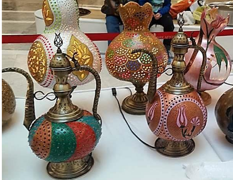
Fotoğraf 12. Afyonkarahisar Halk Eğitim Merkezi'nin 5-6 Mayıs 2018 tarihinde Park Alışveriş Merkezi'nde açmış olduğu "Su kabağı işlemeciliği" sergisinde ibrik lambalar (Küçükkurt, 2018).