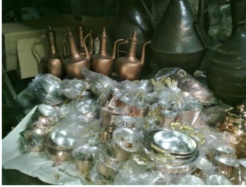
Fotoğraf 1. Bolu/Mudurnu’da bakır ve kalay ustası Mehmet Arıbakır’ın atölyesinde bakır ibrikler (Küçük Kurt, 2012).

Dîvânu Luğâti’t-Türk’te “İbrik”, “Iwrık” olarak bulunmaktadır: “Iwrık başı kazlayu Sagrak tolu közleyu Sakinç kodı kizleyü Tün kün bile sewnelim” (Ercilasun ve Akkoyunlu, 2015: 49).