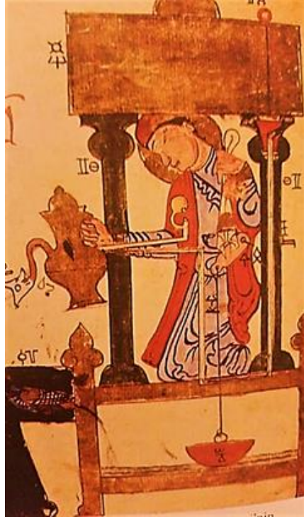
Fotoğraf 2. Ebu'l-İz İsmail b.ar-Razzaz el-Cezere'nin "Otomata" adıyla kısaltılan 1206 tarihli eserinden. Topkapı Sarayı Kütüphanesi. Envanter No. 3472 (Fırat, 1996: 60).

ülüğü ördek biçiminde ibrik, abdest almak için su döken otomattır (Bkz Fotoğraf 2) (Unat, 2002: 3).