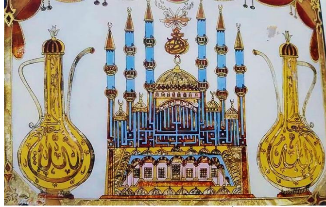
Fotoğraf 5. Stilize Sultanahmet Camisi (Küfi Yazılı, İbrikli), Robert Anhegger/Mualla Eyuboğlu Anhegger Koleksiyonu (Cam, 1997: 84).

bereket dileyen ibrikli kompozisyonlar asılmıştır (Aksoy, 1997: 17, 27). (Cam, 1997: 84, 85, 98, 99, 105). (Bkz. Fotoğraf 5).