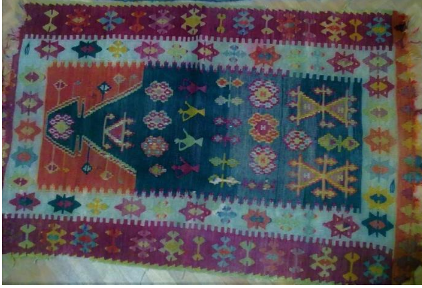
Fotoğraf 11. Afyonkarahisar Bayat kiliminde ibrik motifi, boyutu: 112cmx154cm (Küçükkurt, 2017).