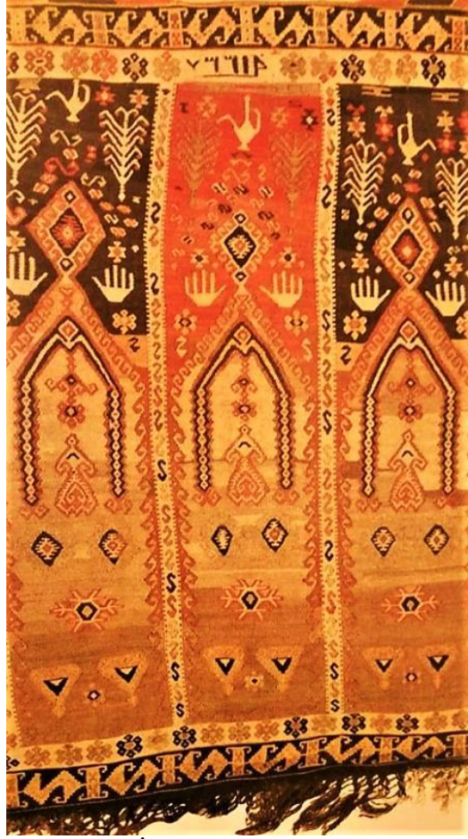
Fotoğraf 10. İstanbul Türk ve İslam Eserleri Müzesi'nde 1737 envanter numaralı Kars Yöresi Kilimi (Erbek, 1988:54)

Bir diğer örnek, İstanbul Türk ve İslam Eserleri Müzesi'nde sergilenen 1737 envanter numaralı Kars yöresine ait saf seccadedir. 20. yüzyılda dokunmuştur. Boyutu,122cmx128cm kilimin mihrap başlarına ibrik motifi yerleştirilmiştir. Bu saf seccade ibrik, hayat ağacı, yıldız, çengel, ejderha, kuş, el ve elibeline motifi ile dekore edilmiştir (Bkz. Fotoğraf 10). Elibeline motifi kadının doğurganlığını sembolize eder. İbrik motifi dokumacının çocuk beklediğini göstermektedir (Erbek, 1988: 54). İstanbul Türk ve İslam Eserleri Müzesinde sergilenen, 128cmx174cm boyutunda, 20yy, Sivas kiliminde (Erbek, 1995:196), Afyonkarahisar Bayat kilimlerinde ve birçok yöre dokumalarında ibrik motifi kullanılmıştır (Bkz. Fotoğraf 11).