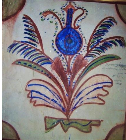
Fotoğraf 4. 1860 yılında yaptırılmış Afyonkarahisar'ın Konarı Köy Odası, kalem işi ibrik süslemesi (Küçükkurt, 2009).

Cami ve evlerin kalem işi süslemelerinde, genellikle dini motiflerin yoğun olduğu duvarlarda ibrik şekli uygulanmıştır. Çiçek süslemelerinin üstünde, Arapça yazı bloklarının aralarında ayrıca ahşap dolap kapaklarının süslenmesinde ibrik motifi kullanılmıştır (Bkz. Fotoğraf 4). Cami kalem işi süslemelerinde ibrik bezemesine verilebilecek güzel örneklerden birisi Afyonkarahisar'dadır. Afyonkarahisar Akkeçili köyü camisinin mihrap üstüne kalem işi ibrik formunda “Gaffar”, “Maşallah” ve “Kalem suresinin 1. Ayeti” yazılmıştır (Algaç 2018: 137).