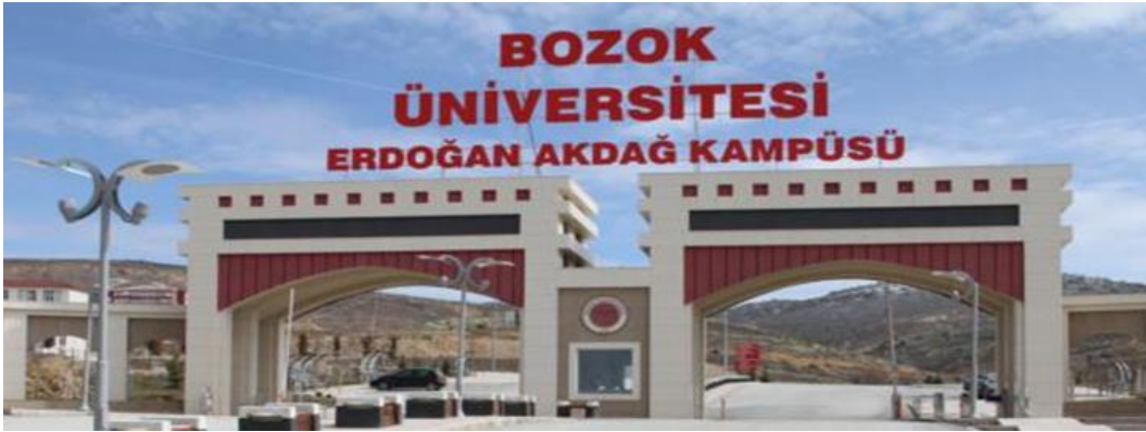
Şekil 18. Bozok Üniversitesi giriş kapısı (URL18)

Yukarıda gösterilen Türkiye'nin farklı büyüklükte ve farklı bölgelerdeki kentlerinde bulunan üniversitelerin giriş/nizamiye kapıları üslup bağlamında incelendiğinde ilk olarak karşımıza çıkan bulgulardan biri, üniversiteler için bir kimlik niteliğinde olan kapıların önemli ölçüde ortak bir mimarlık diline sahip olduklarıdır. Bu mimarlık dili bağlamında; tarihsel karakterdeki sütunlar, kubbe kullanımı, kemer kullanımı, Selçuklu üslubuna ait geometrik motifler, kesme taş görünümü, masif yapılanmalar, klasik döneme ait üçgen alınlık kullanımı, ağırlıklı olarak simetrik kurgu ve taş kapı izlenimi veren görünüm belirlenen ortak mimari niteliklerdir. Ayrıca bu noktada bahsedilmesi gereken bir diğer konu, örnek olarak gösterilen üniversite giriş kapılarının aynı zamanda eklektik bir tutum içinde olmaları ve bu eklektik, seçmeci tutumun ortaya çıkardığı çelişkidir. Örnekleri sunulan üniversite giriş kapıları aynı ideolojik temelli yapılanmalar olarak karşımıza çıksa da; giriş kapılarında biçimlendirme amaçlı kullanılan kubbe-üçgen alınlık taş ve cam malzemenin birlikteliği gibi tasarım seçimleri bahsedilen örnekleri seçmeci bir kategoriye taşımaktadır. Bu durumda, çelişkili olarak özlem duyulan tarihsel üsluptan farklılaşan bir mimari ürün ortaya çıkmaktadır ve Selçuklu-Osmanlı mimarlık stili toplumsal belleğe eklektik bir nitelikte aktarılmaktadır.