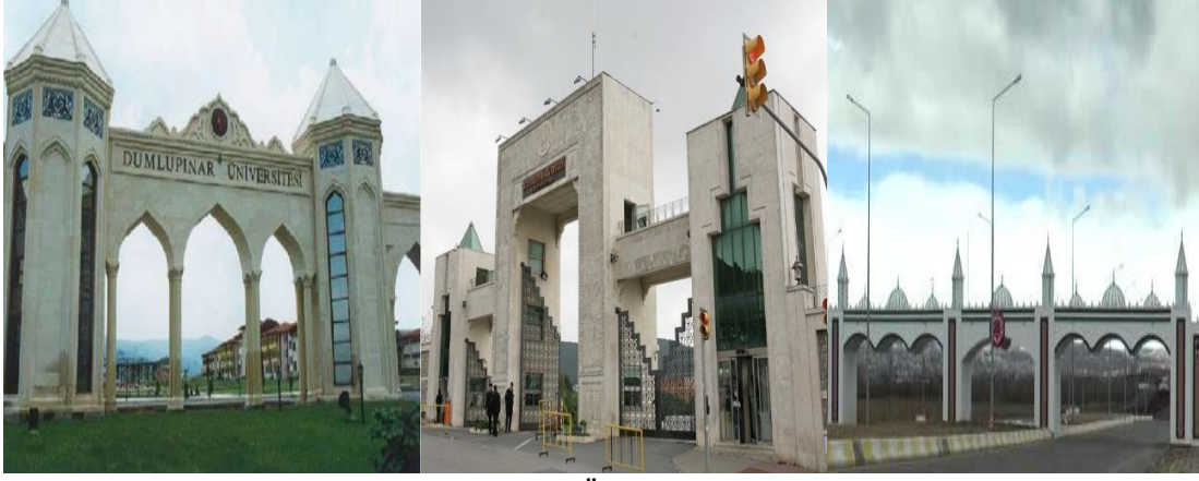
Şekil 6. Kütahya Dumlupınar Üniversitesi giriş kapısı (URL6)

Cumhuriyet Üniversitesi (Şekil 8), Konya Selçuk Üniversitesi (Şekil 9), Niğde Ömer Halisdemir Üniversitesi (Şekil 10), Karamanoğlu Mehmet Bey Üniversitesi (Şekil 11), Sinop Üniversitesi (Şekil 12), Erciyes Üniversitesi (Şekil 13), İstanbul Üniversitesi Büyükçekmece Yerleşkesi (Şekil 14), Atatürk Üniversitesi (Şekil 15), Akdeniz Üniversitesi (Şekil 16), Erzincan Üniversitesi (Şekil 17) ve Bozok Üniversitesi (Şekil 18) bu bağlamda etkili örnekler sunar.