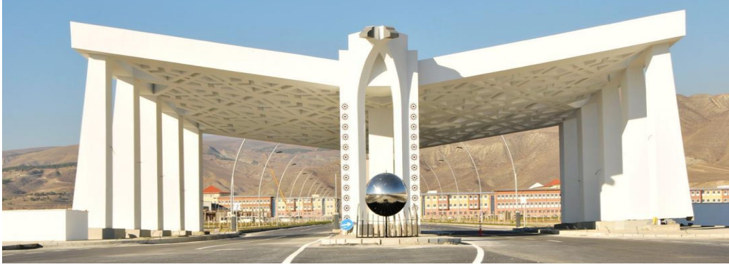
Şekil 17. Erzincan Üniversitesi giriş kapısı (URL17)