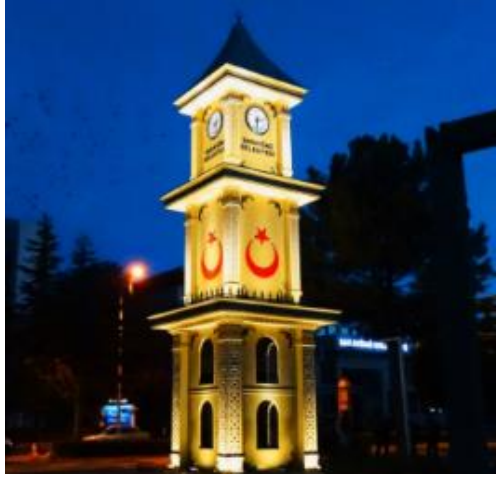
Şekil 3. Sarayönü Belediyesi meydan saati (URL3)