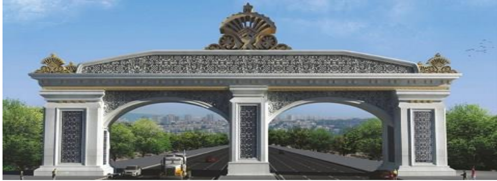
Şekil 4. Ankara kent giriş kapısı (URL4)