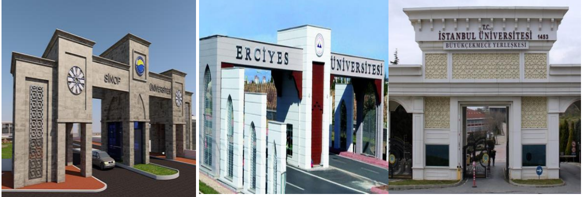
Şekil 12. Sinop Üniversitesi giriş kapısı (URL12)