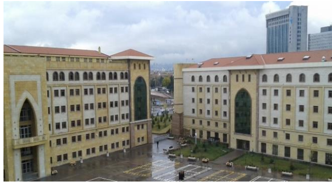
Şekil 1. Lise eğitim yapısı (URL1)