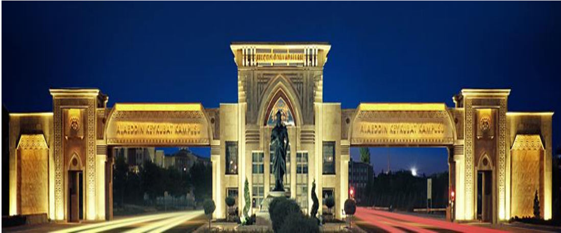
Şekil 9. Selçuk Üniversitesi giriş kapısı (URL9)