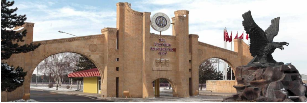
Şekil 15. Atatürk Üniversitesi giriş kapısı (URL15)