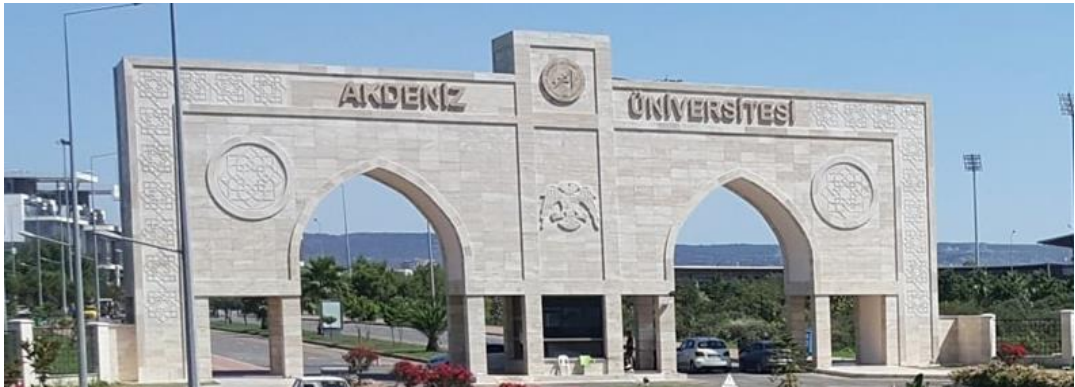
Şekil 16. Akdeniz Üniversitesi giriş kapısı (URL16)