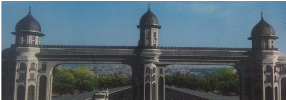
Şekil 5. Ankara kent giriş kapısı (URL5)