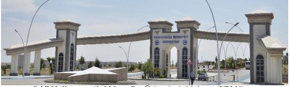
Şekil 11. Karamanoğlu Mehmet Bey Üniversitesi giriş kapısı (URL11)