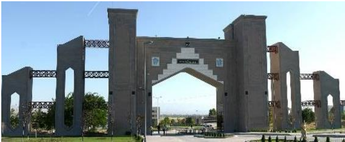
Şekil 10. Niğde Ömer Halisdemir Üniversitesi giriş kapısı (URL10)