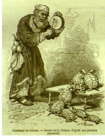
Görsel 6. L. Crépon, Charmeur de tortues, Tour du Monde, 1869.