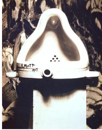
Görsel 1. Marcel Duchamp, Çeşme, Hazır Yapım Nesne, Sırlı Seramik, 1917.

En temel tanımıyla ya da değerlendirmeye «estetik görsel haz» veren bir nesne sanatsal nesne olarak sunuma hazırlanabilir, sergilenebilir. Ancak bir biçimin kendi içsel öğelerinden öte dış belirleyicilerin kriterlerinin bütünü kurumsal sanat kuramı; bilgi, birikim, eğitim gibi ölçütlerle çerçevlendirdiği için Duchamp'ın ready-made (hazır yapım) Mutt imzalı “Fountain” adlı pisuar çalışmasının toplumsal ilişki bağlamında sanatsal birikimi olan bir kişi tarafından yapıldığından kabul görebilmektedir –ki kabul görmüştür ve literatürde kavramsal sanatın başlangıcı olarak da kabul görmektedir (Carroll, 2012).