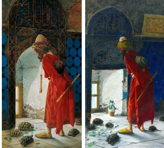
Görsel 7, 8. Osman Hamdi Bey, Kaplumbağa Terbiyecisi 1, Pera Müzesi, 2, Belma Simavi Koleksiyonu, 1906, 1907.