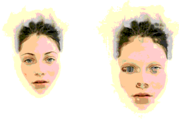
Görsel 4, 5. Berta Vicente, "Xenia", 2012 - Merve Morkoç '2+1', 2014.

Güncelin içinde yer alan geçmişten bir örnek olarak çok tartışmalı ve netameli kabul edilebilir ancak bugün medyanın konuları arasına girmeye başlamış olan bugünkü Mimar Sinan Güzel Sanatlar Üniversitesi kurucusu ve Batıda yaklaşık 10 yıl eğitim alarak Türkiye'ye müzecilik kavramını taşıyan Osman Hamdi Bey'in ünlü çalışması "Kaplumbağa Terbiyecisi". Ünlü Kaplumbağa Terbiyecisi çalışmasının bir esinlenme biraz daha ilerisi temellük bir eylem sonucunda ortaya çıktığı söyleneğelmektedir. Ünlü Fransız dergisi Tour du Monde'de gördüğü "Charmeur de tortues" adlı Japon gravüründen çok etkilendiği düşünülmektedir. Ancak bu kimileri için spekülative sayılabilecek kimileri için de bu yapıt doğrudan doğruya kendine mal etme ya da etkileşimli benzerlik olarak sayılabilir. Zira etkileşimli benzerlik olasıdır. Kaldı ki eser hırsızlığı gibi bir değerlendirme kapsamına gireceğini düşünmek nesnel açıdan eksan kaymasına da neden olabilir. Tüm bunlara karşın bu sanat yapıtının ün ve değer yitimine uğradığını bugün söyleyebilmek çok zordur. Tersine, yapıt Pera Müzesindeki devamlı sergileme koşullarında da ününü tüm dünyaya yaymayı sürdürmektedir.